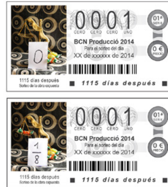
#2 Previsualización de los vales de lotería