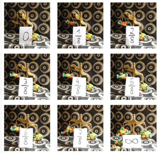
#1 Las imágenes digitales